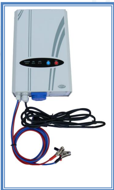
Záložní zdroj pro externí baterii

Záložní zdroje ASTIP jsou OFF-LINE systémy. tzn., že při běhu stávající sítě jsou spotřebiče napájeny ze sítě. Až při jejím poklesu nebo výpadku začne zdroj napájet spotřebiče z akumulátorů. Po dobu zálohy zdroj sleduje pokles napětí na bateriích a před jejich vybitím se vypne. Zdroj tak chrání baterie před poškozením. Nabíjecí proces je plně automatický. Po nabití udržuje nabíječ akumulátory na 100% kapacity. Zdroje napájejí spotřebiče napětím 230V, 50 Hz, a to buď čistě sinovým, nebo napětím s trapézovým průběhem.