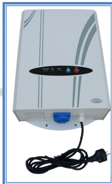
Záložní zdroje pro umístění na zeď. Zdroje obsahují baterie.